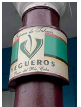
Schon von außen ist deutlich sichtbar, welche Cigarren in dieser Manufaktur hergestellt werden: Vegueros. Doch auch die Cigarren der Marke Trinidad werden hier gefertigt.