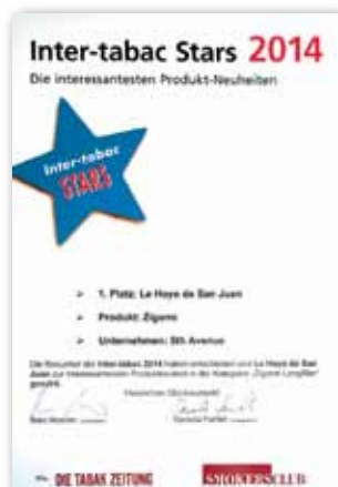
Auf der diesjährigen »Inter-tabac« wählten die Besucher die Le Hoyo de San Juan zur interessantesten Produktneuheit des Jahres 2014.

Die Le Hoyo de San Juan ist mit ihrem gewaltigen 54er Ringmaß ein richtiger Kracher mit mächtig viel Geschmack. Das große Volumen bringt die hervorragende, aromatische Mischung mit ihrer Tabaksüße perfekt zur Geltung. Die exquisiten Tabake von San Juan y Martínez prägen diesen Geschmack ganz entscheidend.